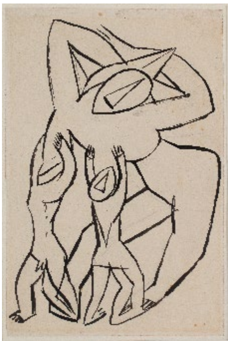
Henri Gaudier-Brzeska (1891-1915), Étude pour Caritas , 1914, graphite et encre noire, 38,1 x 25,5 cm, inv. MO.137.B