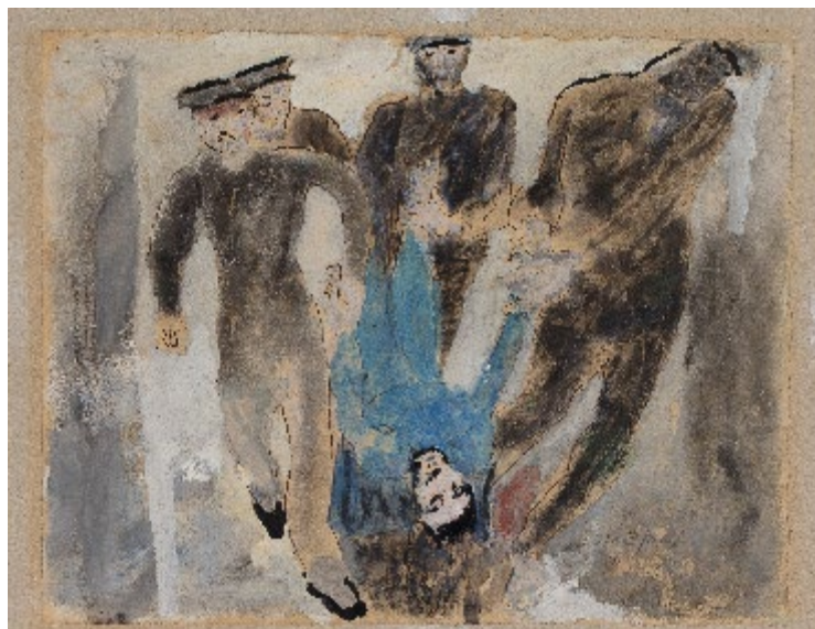
Max Jacob (1876-1944), Vision de Guerre , plume, encre brune, aquarelle, gouache, sur papier marouflé sur carton, 20,6 x 26,7 cm, inv. MO.66.1454