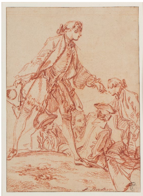
François Boucher (1703-1770), Groupe de cinq gentilshommes , vers 1734-1735, sanguine, filet d'encre noire rapporté, 23,3 x 16,2 cm, inv. 317