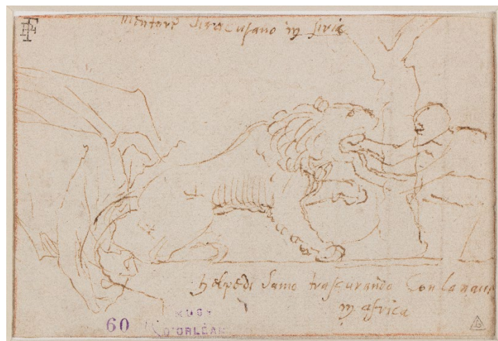
Nicolas Poussin (1594-1665), Un Homme soignant un lion , Croquis d'un groupe de femmes et d'enfants (verso), vers 1636-1638, plume et encre brune ; pierre noire (verso), 9,8 x 14,6 cm, inv. 1240. Album 17.60