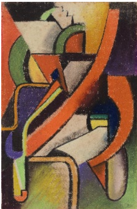
Henri Gaudier-Brzeska (1891-1915), Composition vorticiste , 1914, pastel, 48 x 31 cm, inv. MO.130