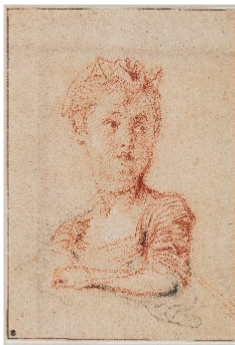
Jean Antoine Watteau (1684-1721), Buste d'enfant , 1717, sanguine, pierre noire et rehauts de craie blanche, 18 x 12,2 cm, inv. 1145