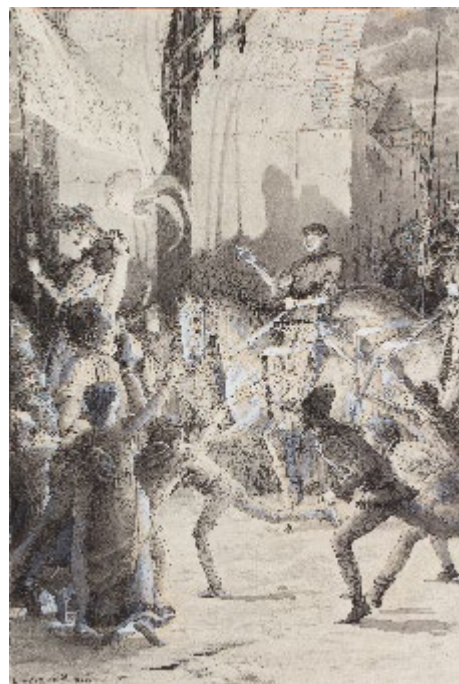
Luc-Olivier Merson (1846-1920) L'Entrée de Jeanne d'Arc à Orléans , 1895, plume, encre et rehauts de gouache blanche sur papier crème, 44 x 31 cm, inv. 998.21.2