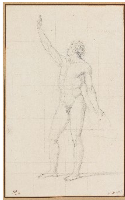
Jacques Louis David (1748-1825), Étude de Barnave nu , pour Le Serment du Jeu de paume , 1791, crayon graphite ; mise au carreau. 30.2 x 18.7 cm. inv.