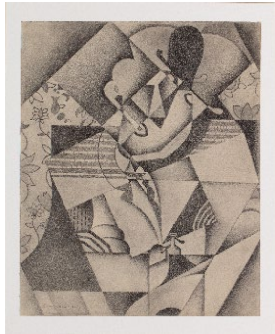
Jean Metzinger (1883-1956), Le Fumeur ( Portrait de Max Jacob ), 1913, mine graphite sur papier, 43,5 x 34 cm, inv. 94.11.1

Toutes les œuvres appartiennent aux collections du musée des Beaux-Arts d'Orléans .