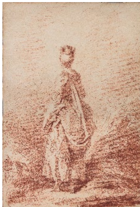
Jean Honoré Fragonard (1732-1806), Jeune femme debout, vue de dos , vers 1770, pierre noire, sanguine, 37 x 25 cm, inv. 726