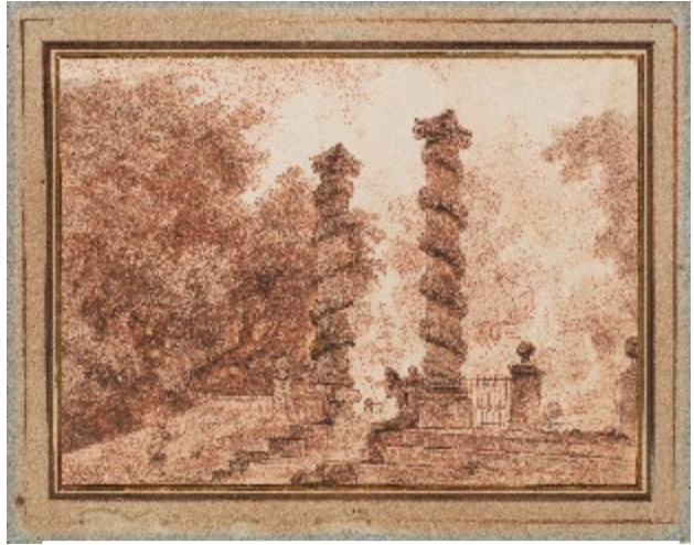
Jean-Honoré Fragonard (1732-1806), Jeux d'eau de la villa Aldobrandini à Frascati , vers 1760-1765, contre-épreuve de sanguine reprise au lavis gris et à la plume et pierre noire, 33,5 x 45 cm, inv. 1069