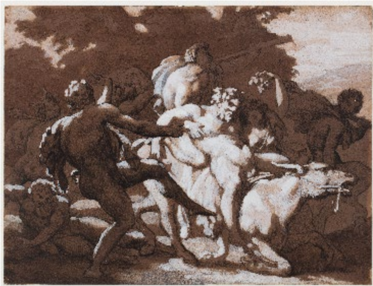
Théodore Géricault (1791-1824), Le Cortège de Silène , vers 1817, crayon Conté, lavis d'encre brune et rehauts de gouache blanche sur papier bistre, 21,5 x 28,5 cm, inv. 738