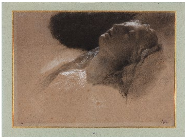
Léon Cogniet (1794-1880), Maria Robusti sur son lit de mort , étude pour Le Tintoret peignant sa fille morte , vers 1843, crayon noir et estompe, sanguine et , rehauts de craie blanche sur papier beige, 40,9 x 54,7 cm, inv. 553