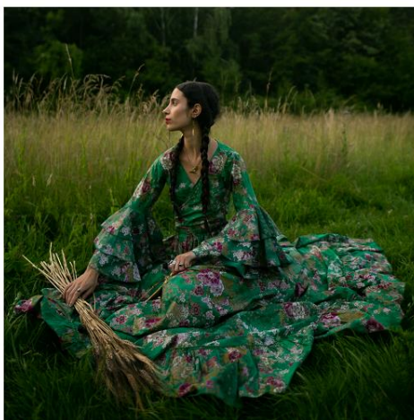
Haut : Milla Leika // Sopycal Bas : chato b // Morjane Ténére

Le dispositif départemental PAPA permet d'offrir aux artistes sélectionnés par un jury professionnel une aide financière ainsi qu'un accompagnement à la stratégie pour la réalisation de leur projet. En partenariat avec le FAIR, il met cette année en avant des artistes aux esthétiques hybrides et diversifiées, à des stades différents de professionnalisation de leur projet.