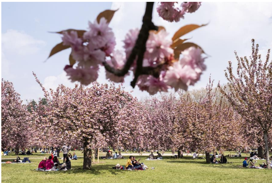
Cerisiers en fleurs au Domaine départemental de Sceaux

Le Domaine de Sceaux – Parc et musée départementaux célèbre Hanami , la floraison des cerisiers japonais. Un événement comme chaque année très attendu, qui fera voyager les visiteurs au pays des Haïkus et au son des tambours Taïko. Au musée, c'est une expérience autour de la joie et du renouveau qui attend le public.