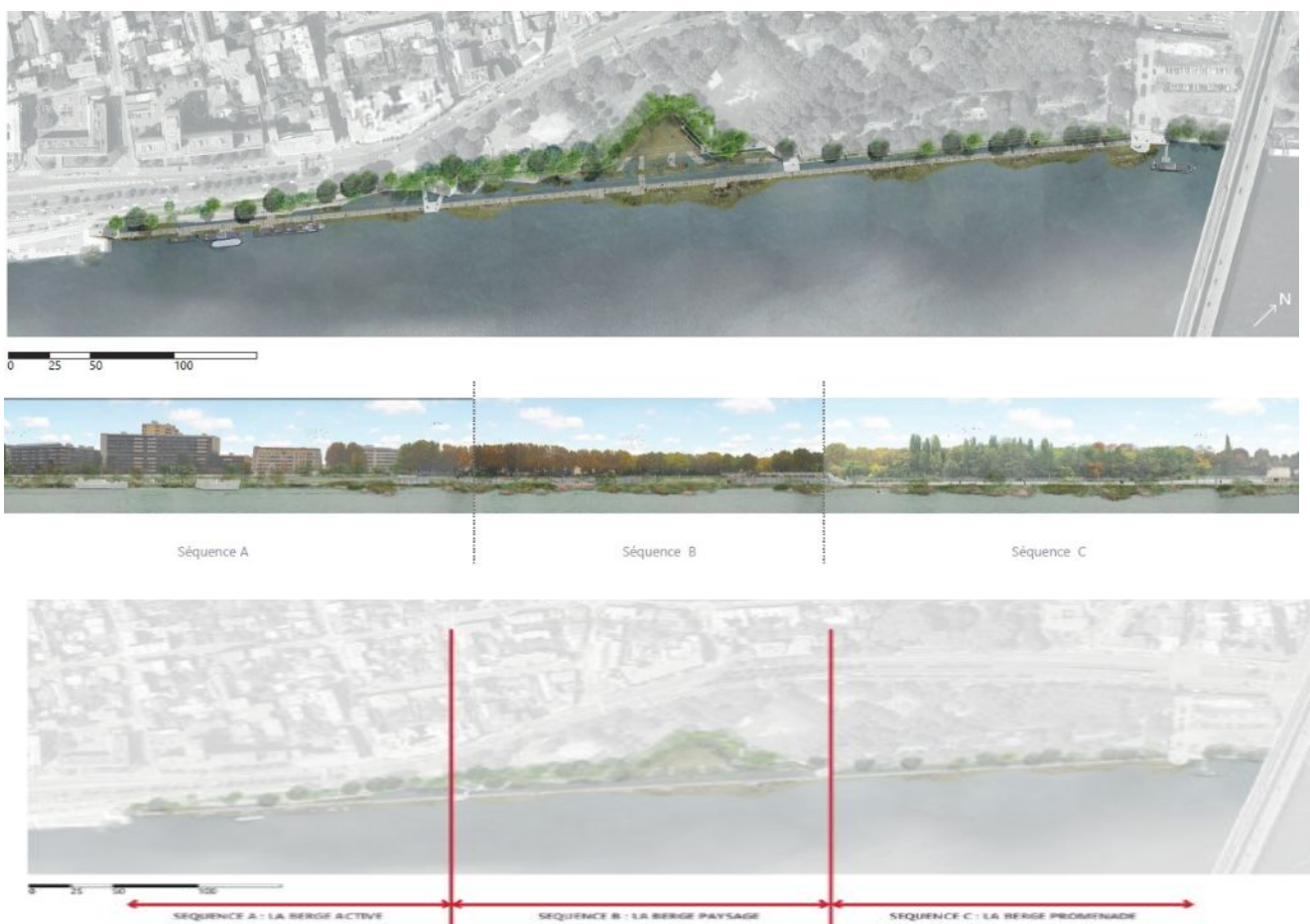
Figure 3: Plan masse, profil en long et séquences paysagères du projet (p.68 de la notice paysagère, p. 23 - 25 de l'EI)

Le projet prévoit la requalification paysagère de la séquence C et la renaturation des berges de la séquence B, notamment par la constitution d'une risberme végétale, c'est-à-dire la création en pied de talus de 1 750 m 2 de jardins d'eau composés de plantes aquatiques à vocation de frayères, complétée par des jardins flottants (1 062 m 2 de jardins sur barges et radeaux arrimés à la promenade) et des plantations sur les berges (p.22-35 ; notice descriptive PJ46).