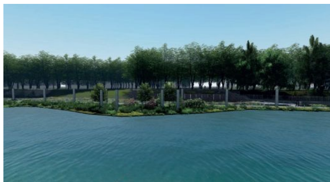
Figure 7: Photo-montage du projet (vue depuis le quai opposé) - Notice paysagère