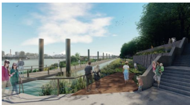
Figure 6: Photo-montage du projet (vue depuis l'accroche entre la séquence B et C) - Notice paysagère

Toutefois, l'articulation du projet avec plusieurs autres projets situés à proximité du site, dont certains poursuivent également des objectifs en faveur d'un cadre de vie plus apaisé, nécessite d'être prise en compte : réaménagement des ports de plaisance Van Gogh et port Bas, situés aux deux extrémités du projet (p.94) ; requalification de la RD 7 (citée p.4 de l'étude faune-flore) ; liaison verte entre le parc Robinson et le centre-ville via le quartier Voltaire, identifiée dans l'OAP « Trame verte » du PLU d'Asnières-sur-Seine.