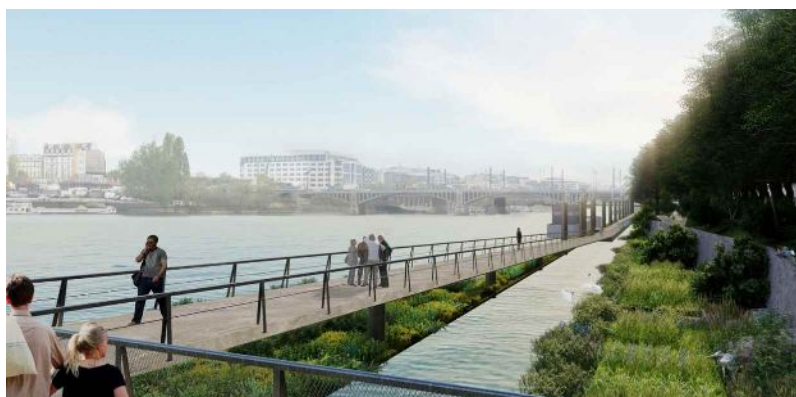
Figure 2: Vue prospective du projet (Atelier Villes et Paysages)