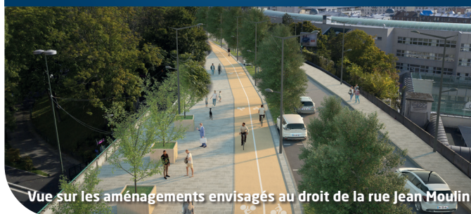
Vue sur les aménagements envisagés au droit de la rue Jean Moulin

La réorganisation des espaces délaissés et la végétalisation du boulevard favoriseront la biodiversité tandis que la circulation apaisée contribuera à diminuer la pollution de l'air et sonore.