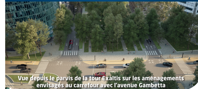
Vue depuis le parvis de la tour Exaltis sur les aménagements envisagés au carrefour avec l'avenue Gambetta

Comme un nouveau lien entre les quartiers de vie et de travail, le boulevard facilitera l'accès des habitants aux équipements publics et permettra à ceux qui y travaillent de découvrir les villes qui le bordent.