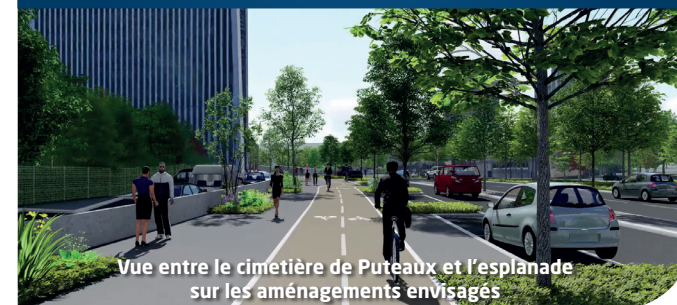
Vue entre le cimetière de Puteaux et l'esplanade sur les aménagements envisagés

L'espace sera partagé par tous les modes de déplacement avec l'aménagement ou la pérennisation des voies cyclables, la création de passages piétons supplémentaires, de places de stationnement et de trottoirs sécurisés.