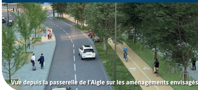
Vue depuis la passerelle de l'Aigle sur les aménagements envisagés

L'aménagement prévoit d'uniformiser le boulevard à deux voies de circulation, et trois voies ponctuellement. Il accueillera de nouveaux équipements (éclairage public, signalisation) et des dispositifs innovants.