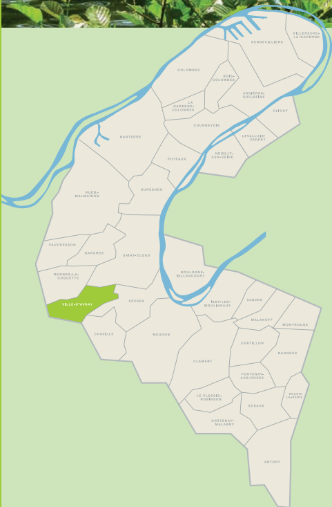
Étangs de Ville-d'Avray