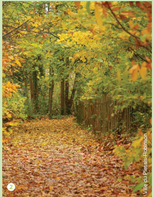
Ville du Plessis-Robinson