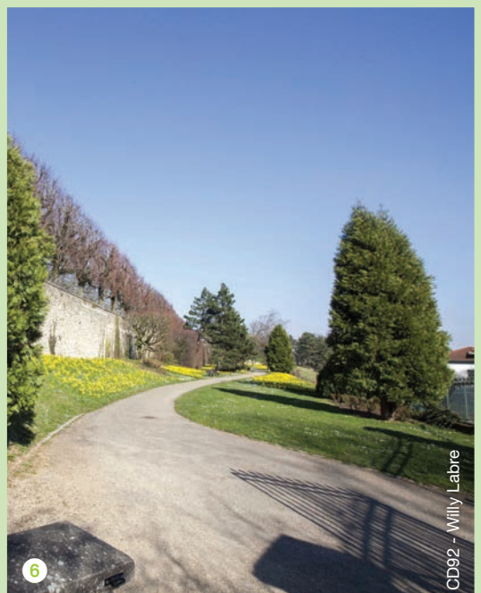
CD92 - Willy Labre