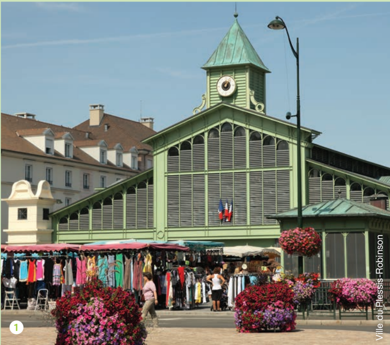
Ville du Plessis-Robinson