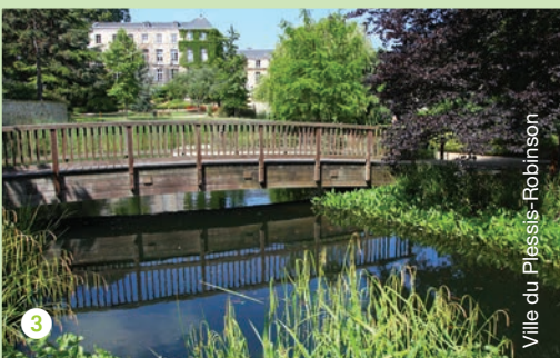
Ville du Plessis-Robinson