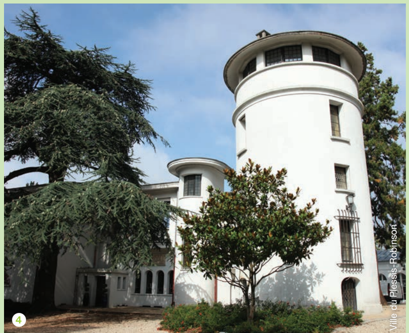
Ville du Plessis-Robinson