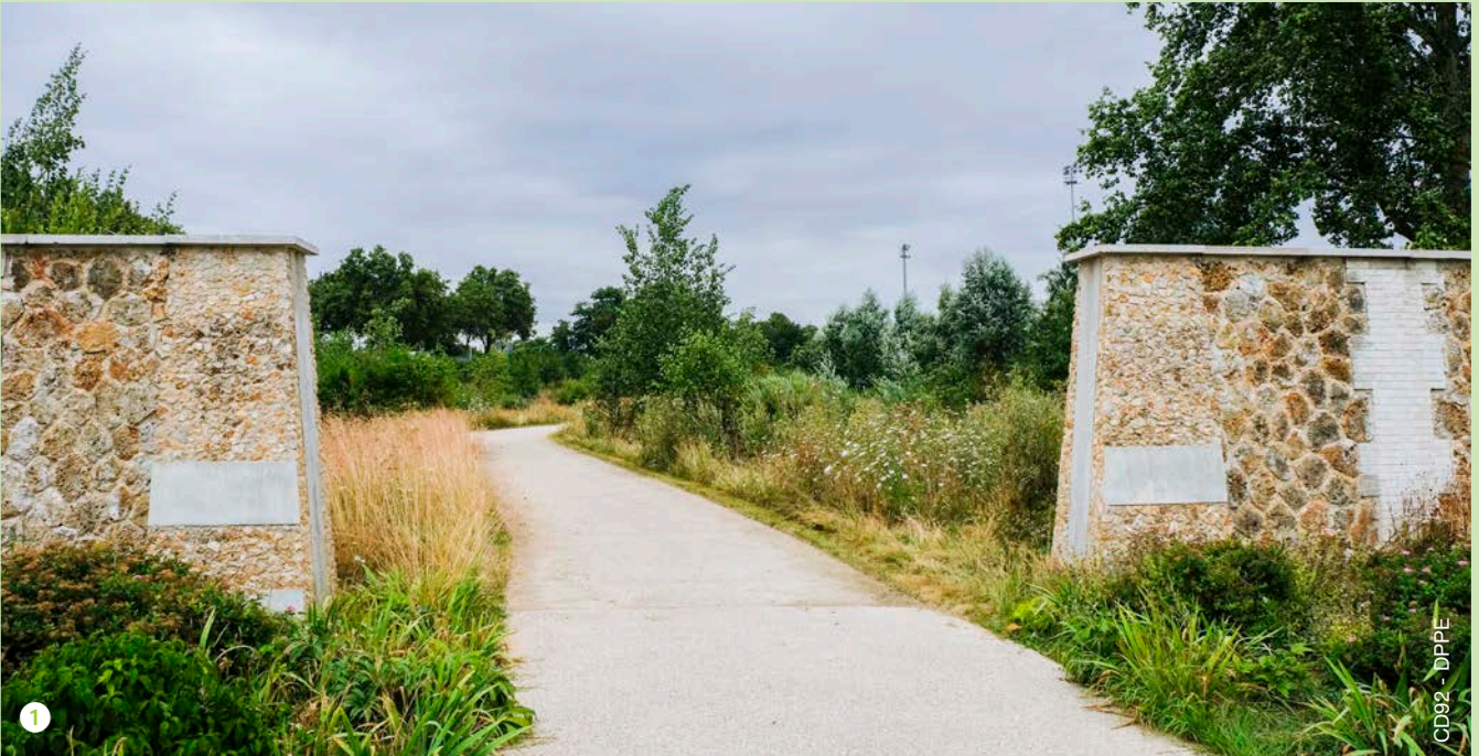
CD92 - DPPE