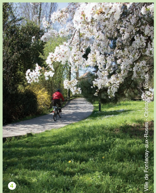
Ville de Fontenay-aux-Roses - Christophe Voisin