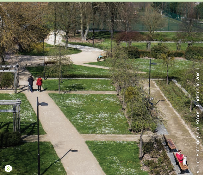
Ville de Fontenay-aux-Roses - Christophe Voisin