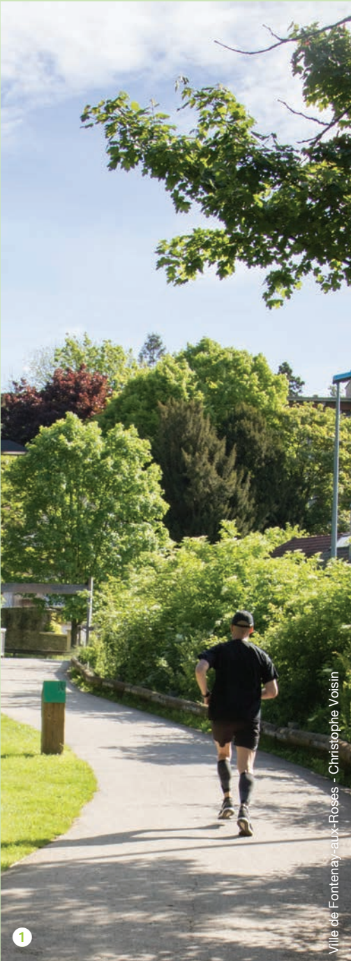
Ville de Fontenay-aux-Roses - Christophe Voisin