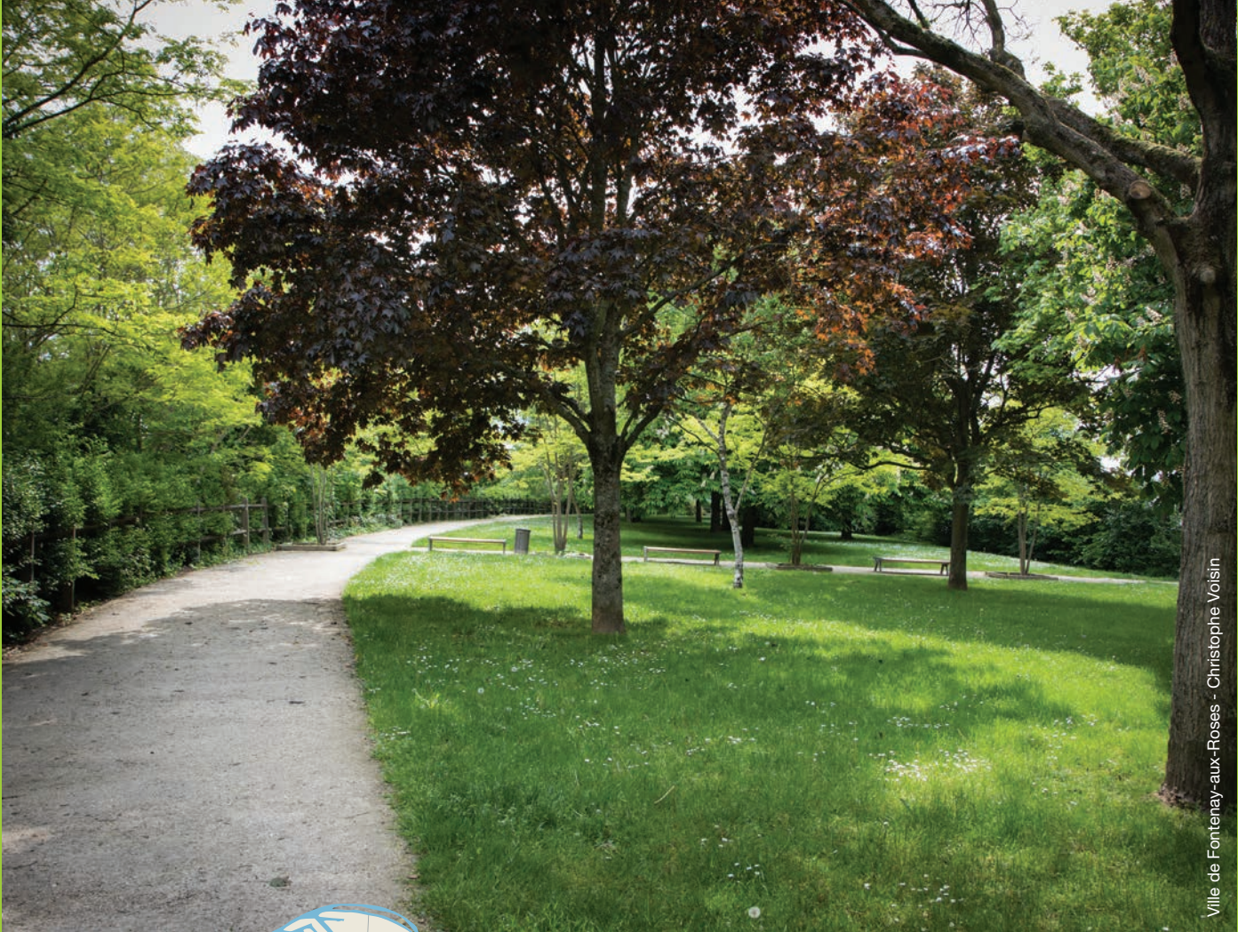
Ville de Fontenay-aux-Roses - Christophe Voisin