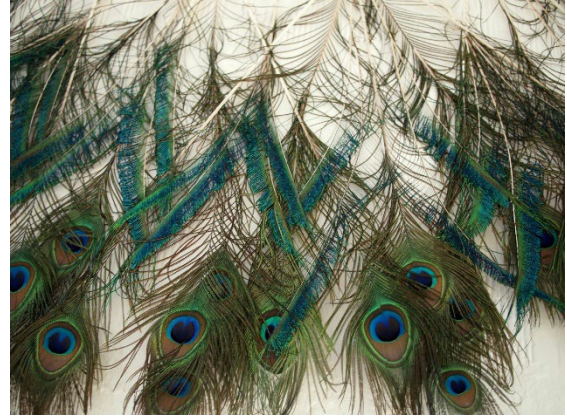
Marie Denis, Azul (détail), 2011, plumes de paon assemblées © Marie Denis courtesy Galerie Alberta Pane Paris/Venise