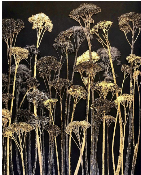
Marie Denis, Les forêts noires et d'Or , 2020, Sédum pressé, patine graphite et or © Marie Denis courtesy Galerie Alberta Pane Paris/Venise