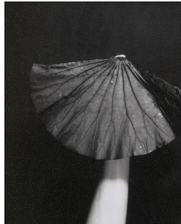
Marie Denis, Photomaton (lotus) , 2014