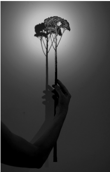
Marie Denis, La main au sedum , 2023, © Marie Denis courtesy Galerie Alberta Pane Paris/Venise