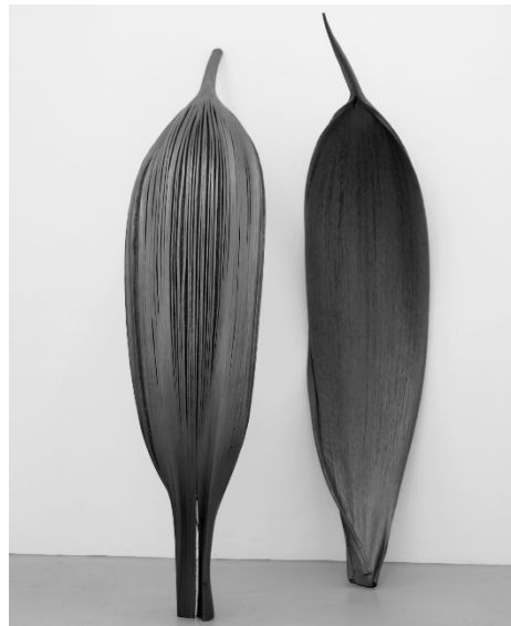
Marie Denis, Nella Wunderkammer (les spathes) , 2019, spathes noires mates (coques de noix de coco) © Marie Denis courtesy Galerie Alberta Pane Paris/Venise