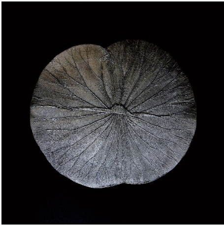
Marie Denis, Lotus iridescent , 2019