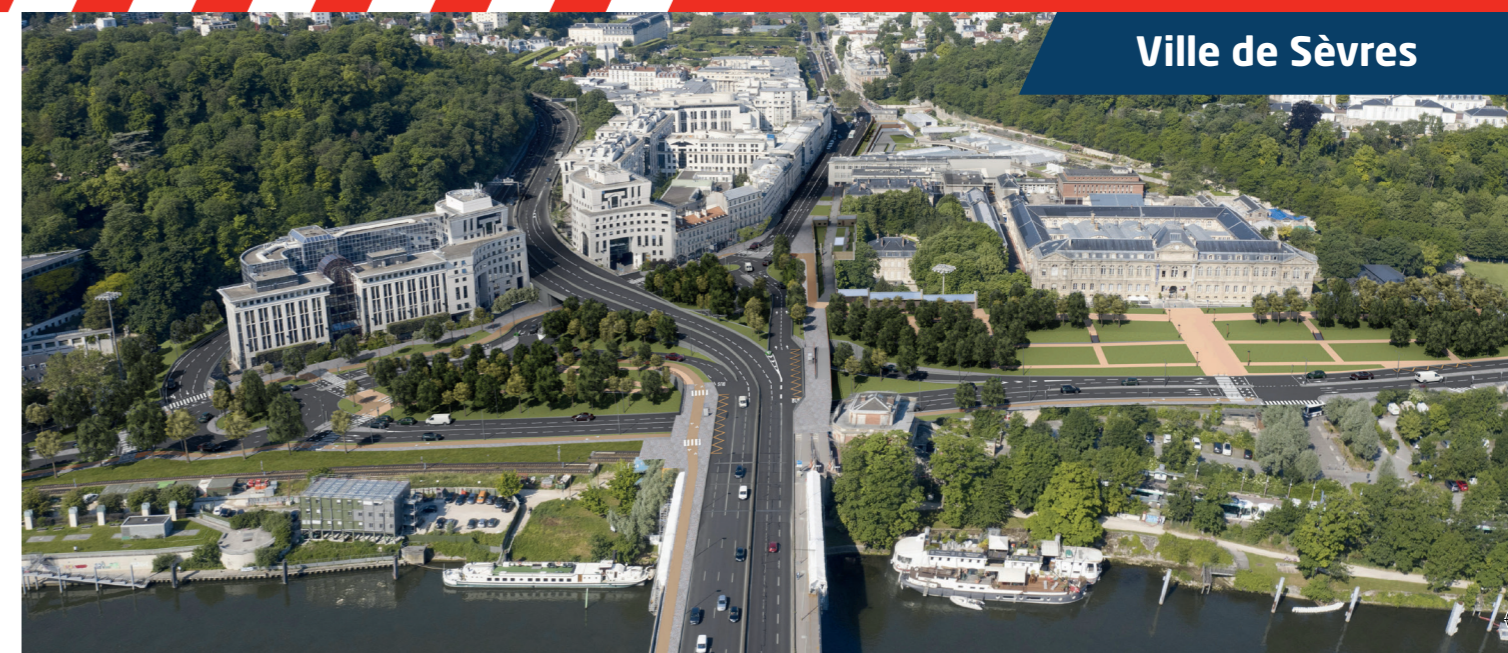
Le futur échangeur urbain - vue depuis le pont de Sèvres