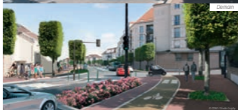
Boulevard de l'hôpital Stell - angle rue Molère