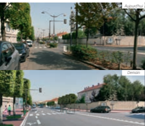
Boulevard de l'hôpital Stell - angle rue Danton

Améliorer la circulation en repensant les aménagements des carrefours.