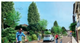
Scénario 1 Contre-allée partagée vue depuis la rue Mougest