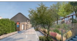
Scénario 2 Piste cyclable vue depuis la rue Mougest