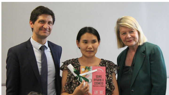
Carl Segaud, Maire de Châtenay-Malabry

Ce lieu d'échanges et de savoir, réunit des femmes aux profils variés : femmes mariées avec ou sans enfant, femmes monoparentales, femmes isolées, en recherche d'emploi, bénéficiaires du RSA, entrepreneures, diplômées ou en situation de précarité.