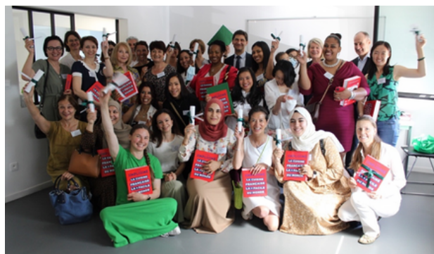
Remise des diplômes 2021 à l'École Française des Femmes de Châtenay-Malabry

Aujourd'hui l'Institut des Hauts-de-Seine compte six Écoles Françaises des Femmes , implantées dans les communes des Hauts-de-Seine suivantes : Antony, Châtenay-Malabry, Clichy-la-Garenne, Fontenay-aux-Roses, Gennevilliers et Nanterre.