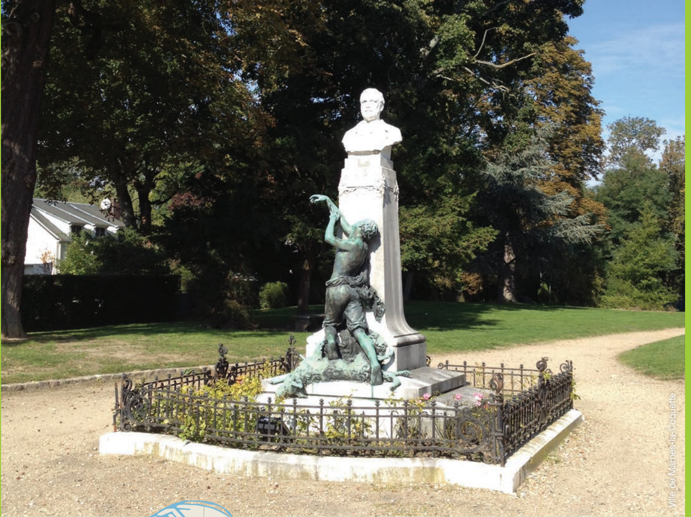
Ville de Marnes-la-Coquette