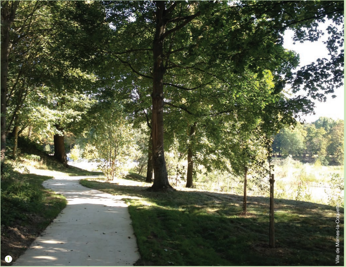
Ville de Marnes-la-Coquette