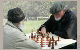
Un espace ludique intergénérationnel