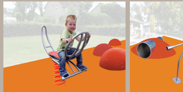
Une aire de jeux clôturée pour les 2-10 ans