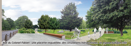
Rue du Colonel Fabien : une placette requalifiée, des circulations hiérarchisées, un espace ludique créé