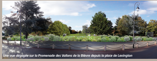
Une vue dégagée sur la Promenade des Vallons de la Bièvre depuis la place de Lexington

L'aménagement vise à requalifier les espaces en s'appuyant sur la végétation existante et les ambiances paysagères particulières qui se dégagent tout au long de la promenade.