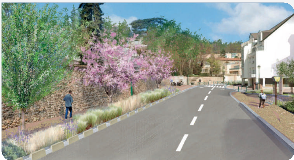
Davantage de zones d'espaces verts plantés - ©Quatrevingtdouze