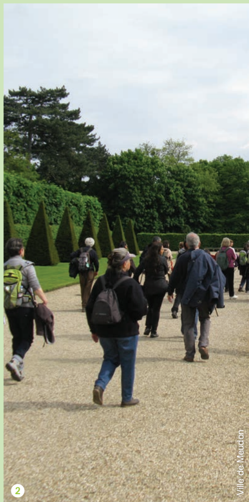
Ville de Meudon