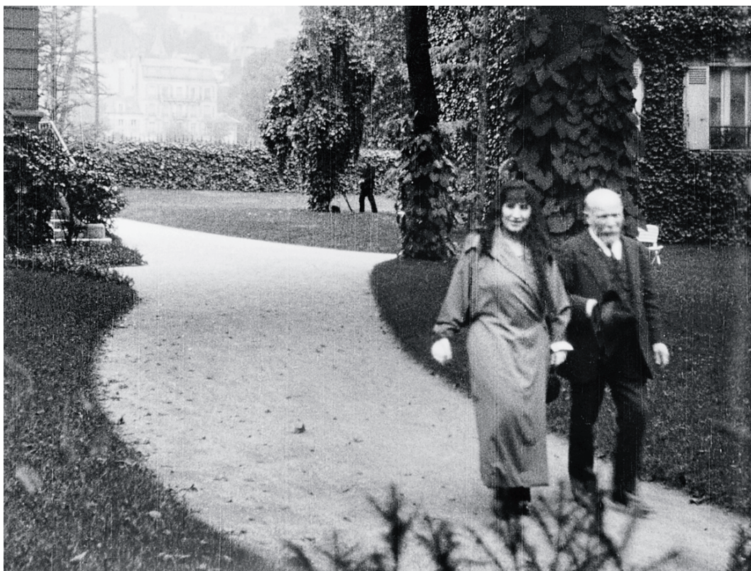
Albert Kahn avec une invitée dans les jardins de sa propriété de Boulogne, 19 septembre 1922. Film noir & blanc 35 mm de l'opérateur Camille Sauvageot, producteur Albert Kahn, inv 87757.