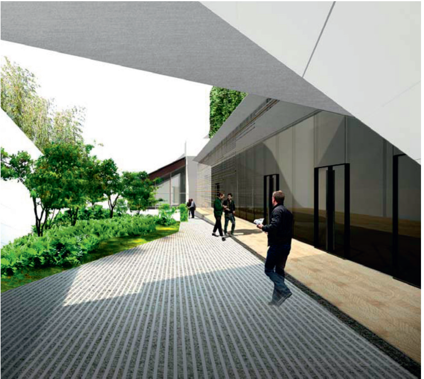
▲ Évocation d'un jardin zen