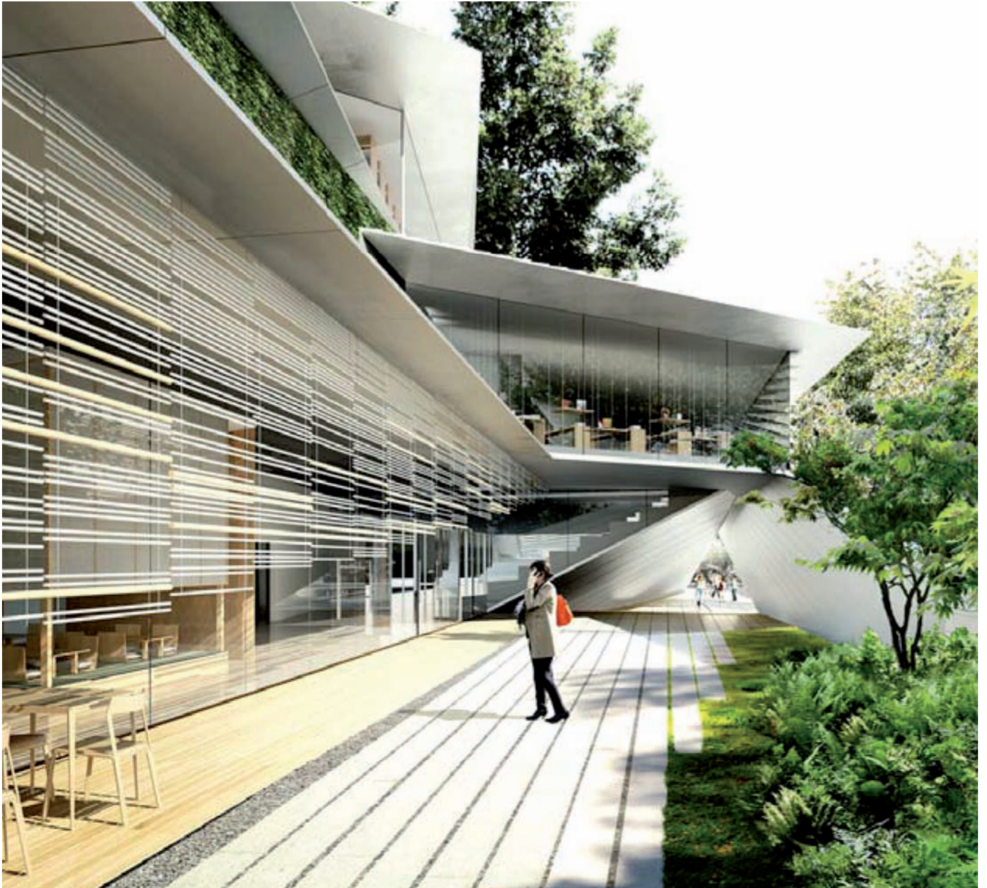
▲ Façade sud du nouveau musée Albert-Kahn, rue du Port : jardin intérieur