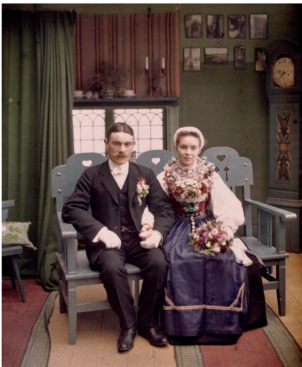
Jeunes mariés dans l'atelier de la photographe Gerda Söderlund à Karingberget, Leksand, Suède, 28 août 1910. Autochrome d'Auguste Léon, inv. A 417. ©Département des Hauts-de-Seine - Musée départemental Albert-Kahn - collection Archives de la Planète.

La création d'un parcours de référence, élément essentiel du projet de rénovation, permettra d'évaluer l'originalité du projet de Kahn, de le réinscrire dans l'histoire des idées et dans la production scientifique de l'époque, de montrer le lien existant entre les collections images et les collections jardins. Ce parcours commencera dans le nouveau musée puis se déploiera dans les bâtiments patrimoniaux, alternant visite des jardins et des espaces muséographiques.